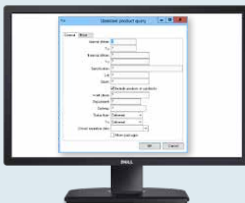
Der Suchbildschirm bietet eine große Auswahl von Suchoptionen, um jeden Artikel im Lager zu verfolgen.

Alle wichtigen Aktionen wie die Artikelbestellung, die Wareneingang oder die Artikelausgabe werden detailliert protokolliert.