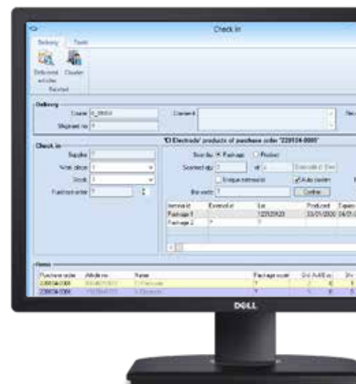
Eingabemaske zur Artikelannahme.

Optional können Barcode-Etiketten für die gelieferten Artikel automatisch gedruckt werden. Während der Anmeldeprozedur ist es darüber hinaus möglich, den Lieferanten, die Liefernummer, die Charge und das Verfallsdatum anzugeben.